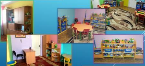
Збірка для групової роботи (LEGO)